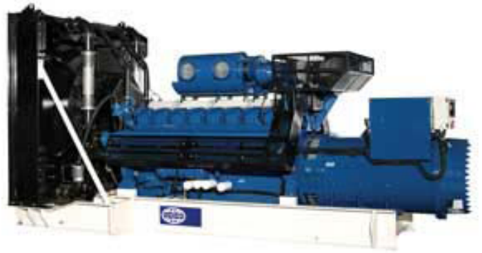
Рисунок приведен исключительно с иллюстративной целью